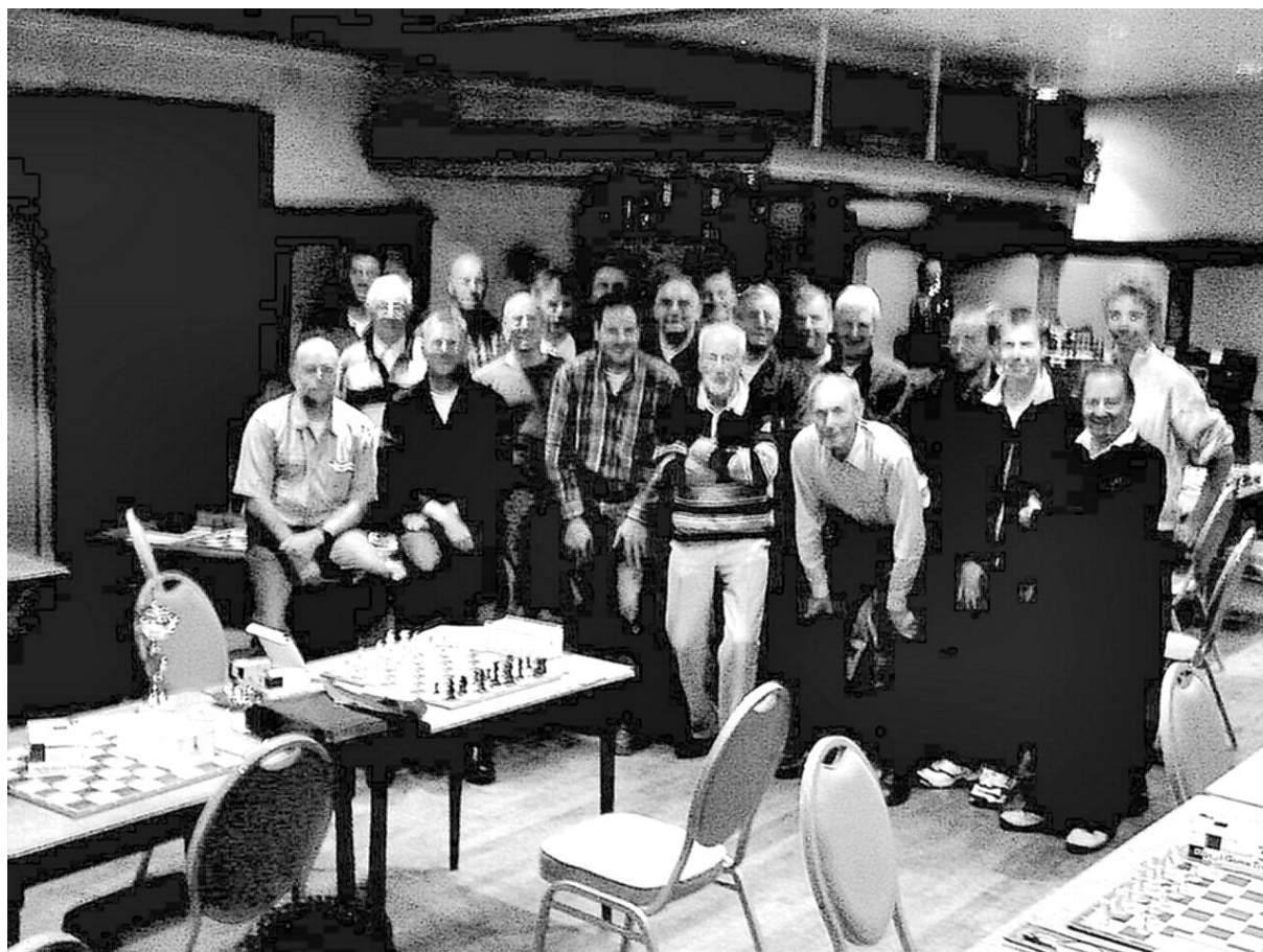
Foto genomen op een van de recentste clubavonden.